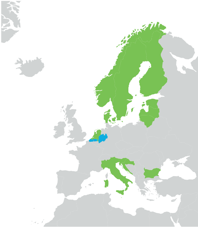
Kuvio 1. ICCS 2016 Eurooppa-arviointiin osallistuneet maat (merkitty vihreällä) tai alueet (merkitty sinisellä)

Vuoden 2016 tutkimuksen Eurooppa-arvioinnissa ei enää vuoden 2009 arvioinnin tapaan ollut tiedollista osuutta, vaan pelkästään oppilaiden eurooppalaiseen kansalaisuuteen liittyviä käsityksiä ja asenteita kartoittanut kysely. Kyselylomake koostui pääosin Likert-asteikollisista kysymyksistä. Eurooppa-arviointiin osallistuneet maat päättivät yhdessä kyselyn sisällön. Kyselyä kehitettiin samaan aikaan kuin muitakin ICCS 2016 -tutkimuksen instrumentteja ja kansalliset koordinaattorit osallistuivat eri vaiheisiin kommentoien. Vuoden 2016 ICCS-tutkimuksen Eurooppa-arvioinnin kysymykset käsittelivät seuraavia aiheita: